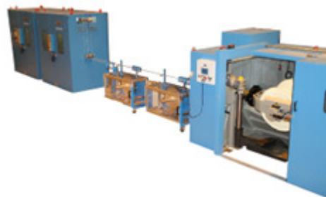
SETIC Paarverseil- und Sternvierermaschine mit Rückdrehung 800 mm

Tel.: +33 4 77 23 25 55 Fax : +33 4 77 71 10 85 setic@gaudergroup.com www.pourtier-setic.com