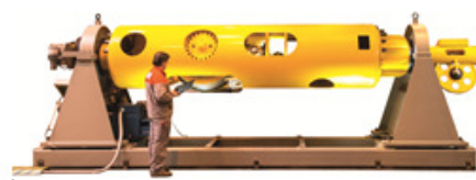
SETIC CRT1000-6T rotierender Bandabzug 1.000 mm, 6 Tonnen Zugkraft für 61 Drähte