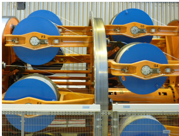
POURTIER Korbverseilmachine, 1.000 mm

Tel.: +33 1 64 21 84 00 Fax : +33 1 64 26 61 10 pourtier@gaudergroup.com www.pourtier-setic.com