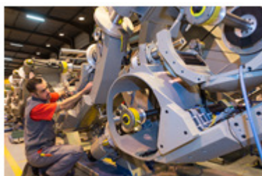
C2S Services und Upgrades