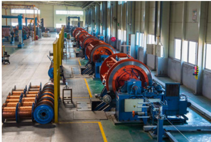
DALOO - KZ 630 91 Spulen

Ein Mitglied der Gauder Group No. 10 Fukang Road, Xinbei District, Changzhou 213000 Provinz Jiangsun P.R. CHINA Tel. offices : +86 519 8548 3550 Fax : +86 519 8548 3557 sales@daloo-machines.com www.daloo-machines.com