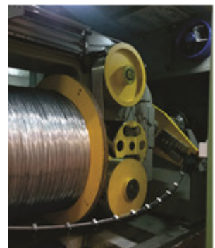
Bügel für große Doppelschlagverseilmaschine